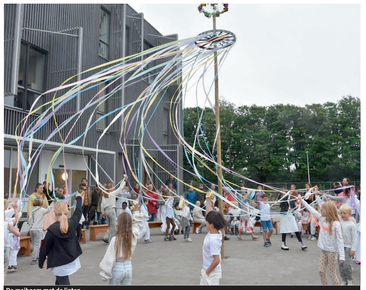
De meiboom met de linten

Hoogtepunt van het feest is het dansen rond de meiboom. De meiboom is een hoge paal, versierd met bloemen en linten. Deze staat symbool voor vruchtbaarheid, maar kan ook worden gezien als een verbinding tussen hemel en aarde.