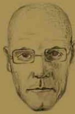
Michel Foucault 1926-1984