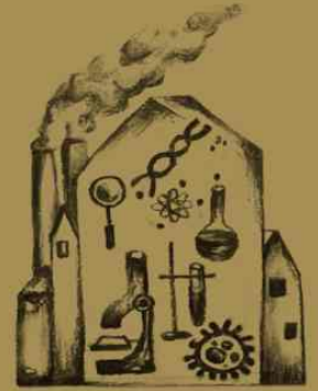
Stills uit de video Biomacht.