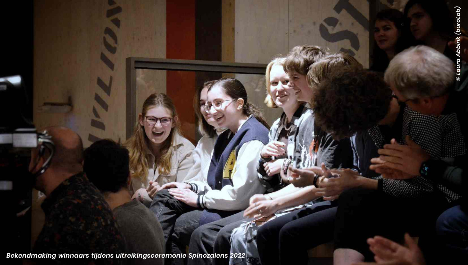
Bekendmaking winnaars tijdens uitreikingceremonie Spinozalens 2022

Men noemt het project 'goed georganiseerd' en 'didactisch sterk neergezet'. Betekenisvoller onderwijs bestaat volgens mij niet!', stelt een docent. De video's met mini-masterclasses krijgen een acht. Twee docenten vinden de filmpjes iets te kinderachtig, een andere docent vindt de kwaliteit van de belichting en het geluid matig. De templates voor leerlingen worden met een 8,5 gewaardeerd. Eén docent schrijft: 'Mijn leerlingen hebben er echt iets van geleerd.'